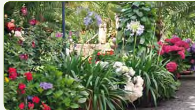
Motiv: Hofstelle in Kemmern, Landkreis Bamberg.